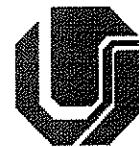
Tabela de Valores dos Serviços da Rádio Universitária: